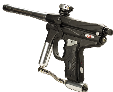
Marcador PMI Piranha GTI

Sem entrar em detalhes técnicos podemos referir que é um kit em que o marcador é já electrónico e não mecânico à semelhança do que outros promotores deste tipo de actividade utilizam. De referir também que como sistema de propulsão para as bolas, utilizamos botijas de ar comprimido ao invés da pratica comum que é usar-se botijas de CO2 (poluente para a atmosfera).